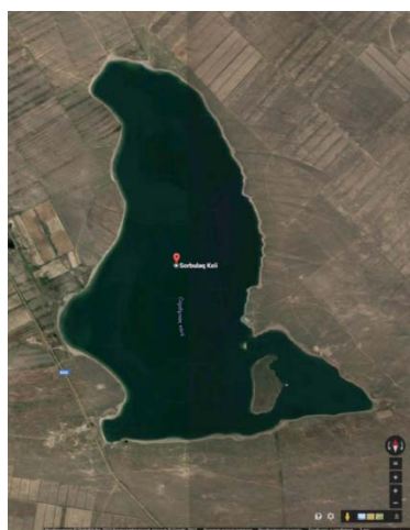
Satellite image of “Sorbulak” lake-settler