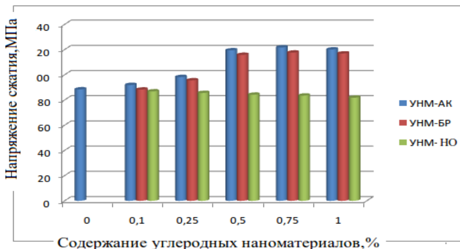
Рисунок 3 - Зависимость предела прочности при сжатии образцов ПКМ от содержания добавок углеродных наноматериалов: УНМ-АК – УНМ обработанные с азотной кислотой, УНМ-БР – УНМ обработанные парами брома, УНМ-НО- необработанные УНМ

Обладая комплексом положительных свойств, эпоксидные смолы имеют существенные недостатки – высокие горючесть и жесткость. Введение наноструктур в ПКМ позволяет повысить прочность образующегося кокса. Быстрое создание закоксованного поверхностного слоя, имеющего хорошую адгезию к основной массе материала, препятствует при воздействии одного и того же огневого источника развитию процесса горения (таблица 1).