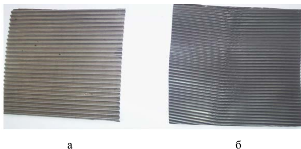
1-сурет – Гофрленген фольга үлгілері: а – қарапайым типті каналды фольга; б – «шеврон типті» каналды фольга

орап цилиндрлі блок жасалады. Фольганың беті тазартылып жуылатындықтан, блок каналдарындағы қалдық сулардан арылу мақсатында блоктар кептіргіш шкафта вертикальды жағдайда 2 сағат бойы кептіріледі. Дайын металды блок күймеген және бастапқы формасын бұзбаған болуы қажет (2-сурет).